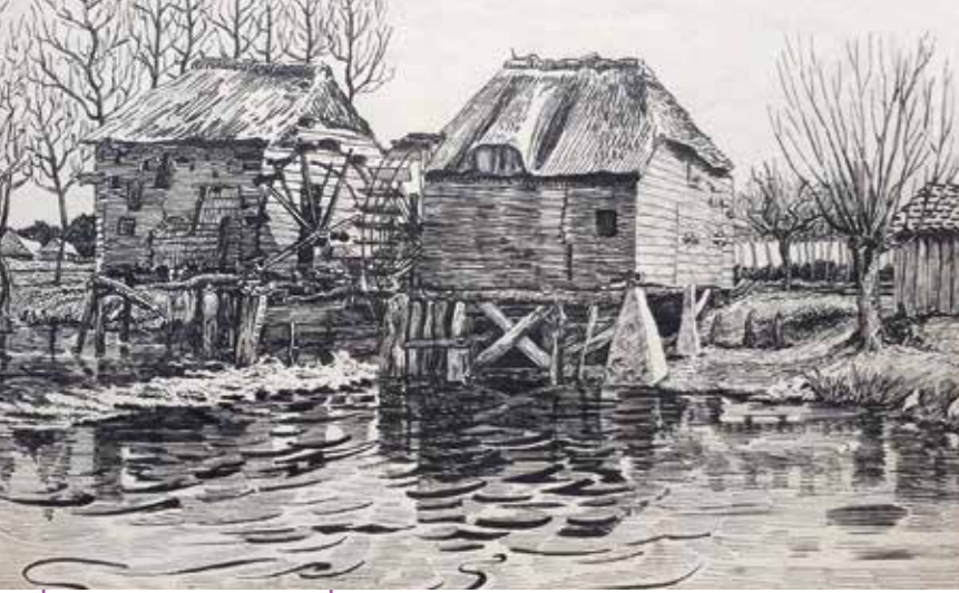
Tekening Waterradmolen te Wolfswinkel (bij Son) omstreeks 1930 bij 'Nabeschouwing', in: Het Huisgezin , 29 april 1955. (Bron: Brabants dorpsleven 2019, deel 7, Ambacht, p. 200-202)