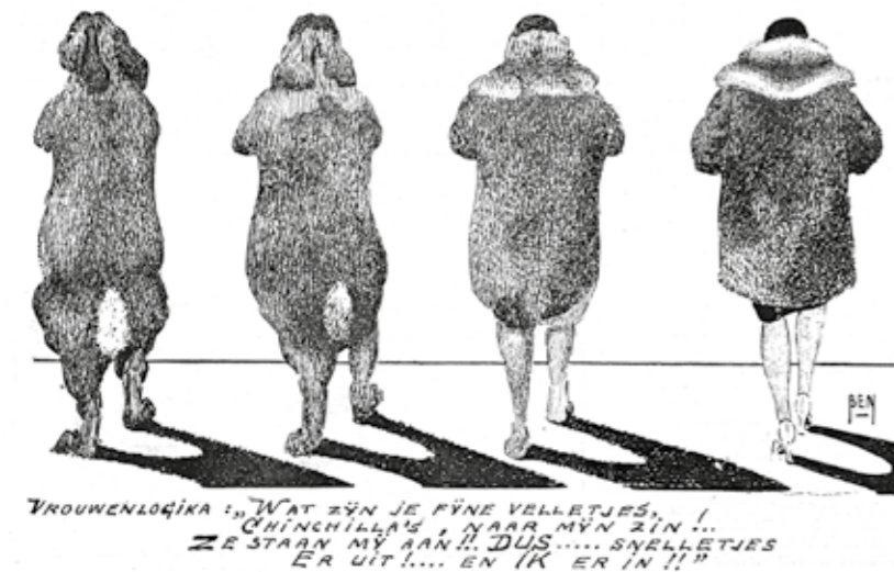
Cartoon bij 'Van Chinchilla's en nog wat', in: Avicultura , 31 mei 1929.

Hij beseftte donders goed dat gebruiken, tradities en kledingstijl met de tijd zouden veranderen. Ze vormden in zijn ogen echter de kern van de Brabantse cultuur. Net als hij zijn afkomst nooit heeft verloochend en zijn geliefde Eerde nooit heeft verlaten, pleitte hij er daarom vurig voor die Brabantse karakteristieken niet met alle veranderingen verloren te laten gaan. Zijn initiatief tot de oprichting van de Heemkundekring De Oude Vrijheid in Sint-Oedenrode in 1941 was dan ook geen bevestiging. Als een van de weinigen in zijn tijd maakte Van Dam zich zorgen over de teloorgang van landschappen en biodiversiteit. Als je vandaag de dag zijn schreeuw om aandacht voor het verdwijnen van de Eerdse Bergen – een langgerekt stuifzandgebied in de Meierij – leest, dan hoor je de milieuactivist van toen. In 1954 publiceerde hij een paginagrote hartenkreet in dagblad Het Huisgezin . Zonder effect: van de Eerdse Bergen is niets meer over. Het naoorlogse economische denken ging ten koste van natuur en landschap, zo was zijn stellige mening.