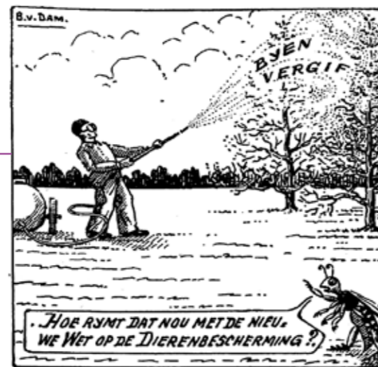
Een vroege waarschuwing van Bernard van Dam. Cartoon in: Sint-Ambrosius , mei 1955.