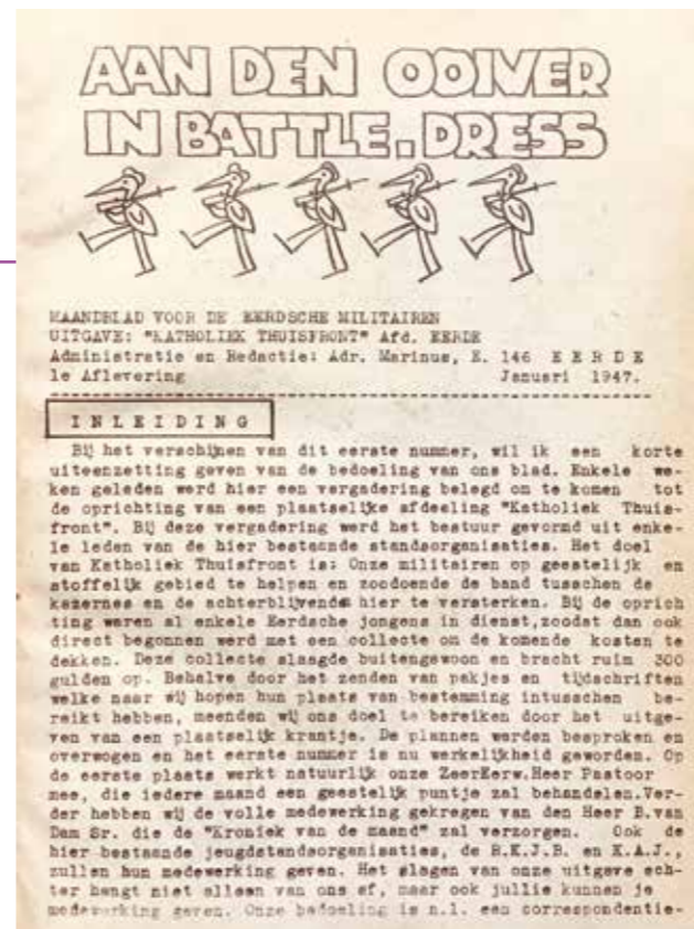
Eerste aflevering van Aan den Ooiver in Battle-dress. Berichten van het thuisfront aan de dienstplichtigen in Nederlands-Indië , januari 1947.

Met zijn andere been verkeerde Van Dam in de lokale wereld van 'd'Eerd' en de omringende Meierij. Van Dam had in zijn jonge jaren duidelijk al een breder wereldbeeld en interesses die verder reikten dan wat je van een molenaar kunt verwachten. Hij zette zich al vroeg af tegen het conventionele leven in een boerendorp in de Meierij. Zijn dandyachtige voorkomen en de wijze waarop hij zijn liefde tot zijn bruid maakte, zijn daar sprekende voorbeelden van. Omdat zijn schoonvader tegen de relatie met zijn dochter was, bedacht hij een list. Hij schaakte zijn geliefde om met haar naar Londen te reizen en samen als getrouwd stel terug te komen, voor een dorp als Eerde anno 1913 een even schokkende als spectaculaire gebeurtenis. Eerde was in de tijd van Van Dam zo'n boerendorp waar de pastoor en de schoolmeester de notabelen waren. Van Dam vormde daarop een aanvulling, geholpen door enerzijds zijn verleden als molenaar en bakker, en anderzijds zijn kennis als schrijver en journalist met een groot netwerk. Voor de boeren en burens was hij bij problemen een bondgenoot en raadgever. Zijn inbreng en betrokkenheid in diverse verenigingen maakten hem tot een spil in de gemeenschap. Hij fungeerde als ombudsman avant la lettre , was bemiddelaar in conflicten en adviseerde boeren