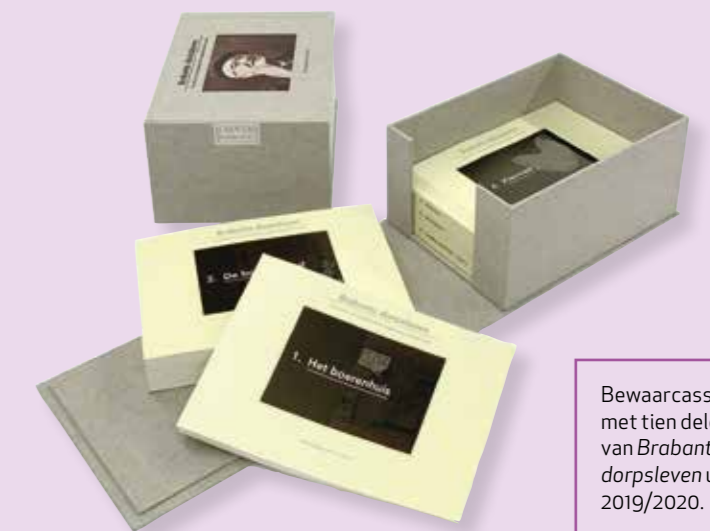
Bewaarcassette met tien delen van Brabants dorpsleven uit 2019/2020.

Stichting Bernard van Dam stelt alle boekdelen digitaal beschikbaar. Ze zijn vrij te lezen en te downloaden voor niet-commercieel gebruik op www.bernardvandam.com . De boekdelen zijn desgewenst – afzonderlijk of als geheel, eventueel in bewaarcassette – in gedrukte vorm te bestellen via genoemde site.