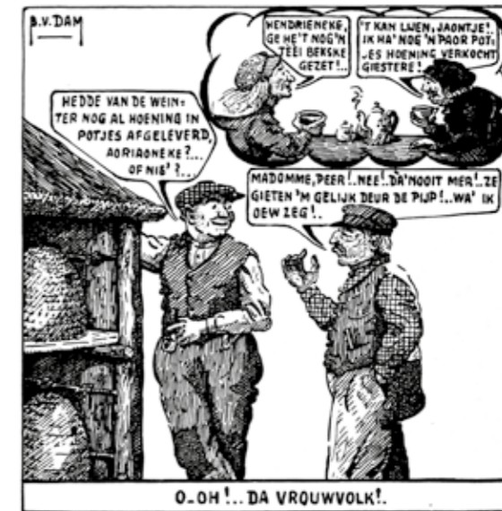
Cartoon in: Sint-Ambrosius , juli 1938. (Bron: Brabants dorpsleven 2019, deel 5. De Bieboer, p. 48)

Van Dam leefde in een periode met grote maatschappelijke en economische ontwikkelingen en hij maakte twee wereldoorlogen mee, zij het vanuit de redelijk beschermde, kleine dorpsgemeenschap van Eerde. Maar zijn scherpe observatievermogen, opmerkzaamheid, brede blik en kennis van wat er onder de dorpsbewoners leefde, brachten hem ertoe om deze grote transformatie op verschillende manieren vast te leggen en te interpreteren. Niet vanaf een afstand of wetenschappelijk standpunt, maar van binnenuit. Bij het doornemen van de thematische delen uit de nieuwe boekenserie is de verleiding groot te vergelijken met de actualiteit van vandaag: nationale landbouwpolitiek, regeldwang en handelsoorlogen drukten ook toen op boer en tuinder. Van Dam zag de agrarische wereld veranderen. Veel veranderde ten goede: techniek deed zijn intrede. Zo werd