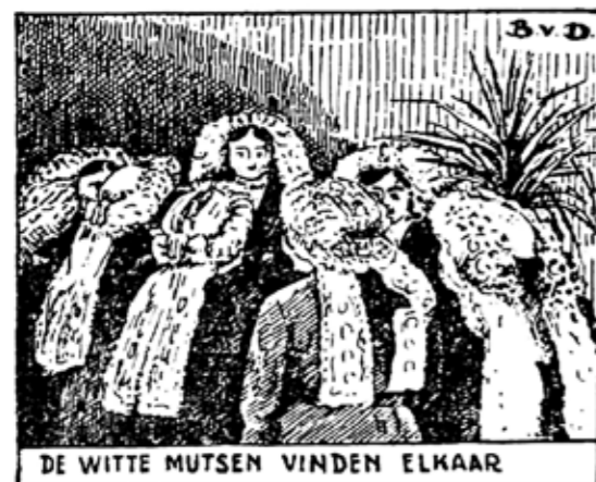
Cartoon bij 'Landbouwtentoonstelling te Oirschot', in: De Boerderij , 5 oktober 1932. (Bron: Brabants dorpsleven , deel 2. De Boerenstand, p. 81-82)

Hij schroomde niet om kritisch verslag te doen van de verwerpelijke gevolgen, zoals de overproductie van aardappelen, die werden doorgedraaid, of overtollig vee dat geruimd moest worden. Ook zag hij hoe de industrie het boerenbedrijf langzaam verdreef. Dat was op zich vooruitgang, maar het stoorde hem dat dit gepaard ging met vervuiling. In een beschrijving uit 1930 van de Biezenerhof, een hoeve bij Geleen, voor De R.K. Boerenstand , doet hij daar gewag van. Hij berustte er toen al in dat het industriële tij niet te keren was: "De tekening geeft wel aan, hoe dat water in vroeger tijden moet geweest zijn en eigenlijk nog zijn moest; maar in werkelijkheid is het een smerige, afschuwelijke modderpap, die tussen de oevers doorstroomt. De Limburgse industrie heeft met haar fabrieken-afval voor altijd aan het lieve riviertje alle poëzie ontnomen. We kunnen hierover jammeren, maar moeten er in berusten." Aan het eind van het artikel doet hij nog een oproep voor steun aan de bewoners: "Laten we hopen, dat de prachtige boerderijen, zoals Biezener Hof en veel anderen, zich mogen staande houden in het Limburgse land.... Familie Peeters, weersta met taai boeren volharding aan den greep van den reus [Van Dam doelt op de Prins Mauritsmijn, BvD en NJ] en behoudt wat ge aan prachtige en kosteliks bezit in uw vruchtbaeren en weelderigen Biezener Hof."