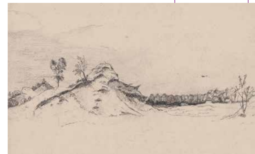
Tekening van de Eerdse Bergen, circa 1940. (Bron: Brabants dorpsleven 2020, deel 10. Observator, p. 78)

onveranderlijkheid vormen de afwijking. Amateurhistorici en heemkundigen hanteren ten onrechte het statische beeld als norm als contrast met een dynamische moderne tijd. Verandering wordt in die optiek stevast beschouwd als verlies. Van Dam zag het duidelijk anders. Met zijn mening over al dan niet gewenste veranderingen beïnvloedde hij de publieke opinie, zowel binnen als buiten Eerde en de Meierij. Niet altijd had dat effect. Zo spreekt zijn aandacht voor de pofferdracht, onder meer in een groot aantal tekeningen, boekdelen. Het verdwijnen van deze dracht markeerde de transformatie van het dorpsleven in zijn omgeving. Van Dam telde in verschillende jaren de poffers met Pasen in de kerk, om zo de verandering met feiten te staven. Ondanks zijn herhaalde pleidooi voor behoud ervan, verdwenen de Brabantse poffer en muts uit het straatbeeld.