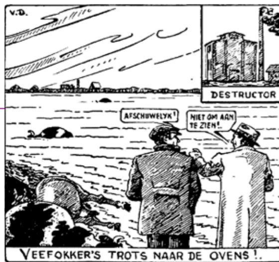
Cartoon bij 'Destructiebedrijven werken op volle toeren', in: Boer en Tuinder , 21 februari 1953. (Bron: Brabants dorpsleven 2019, deel 2. De Boerenstand, p. 171-173)