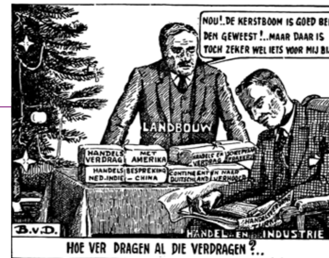
Onder de kerstboom liggen veel handelsverdragen klaar, maar de boer moet nog maar zien wat het hem zal gaan opleveren in het nieuwe jaar. Landbouwkarikatuur in: De Boerderij , 1 januari 1936.