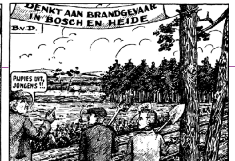
Cartoon in: De Boerderij , 29 mei 1935.

bouw in 1934 en de eerste productie jaren van de 'Destructor' – het ophalen en verwerken van kadavers – in Son. De grootschalige grondontginning, met name in de Peel, en de inpoldering in Noord-Holland stimuleerden de voedselproductie. Het gebruik van kunstmest en teeltverbeteringen deden de Nederlandse export van boter, kaas en eieren alsmat groeien. Dat waren dankbare onderwerpen voor Van Dams trotse cartoons en strips. Tegelijk zag hij de grote nadelen die aan de nieuwe ontwikkelingen kleefden en wees hij in zijn tekeningen op de gevaren voor mens, dier en natuur. In juli 1954 tekende hij bijvoorbeeld een cartoonstrip over slachtoffers van het gebruik van landbouwgif.